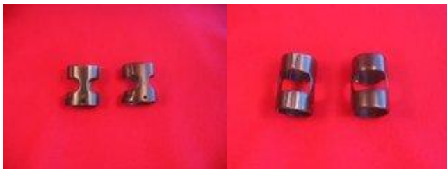
Lisovaný úchyt předpažbí M48BO. (pozor svařovaný)