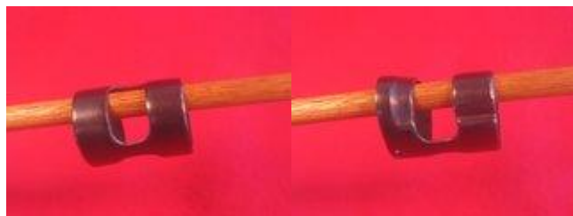
Lisovaný podavač nalevo z M48BO, frézovaný podavač napravo z M48.