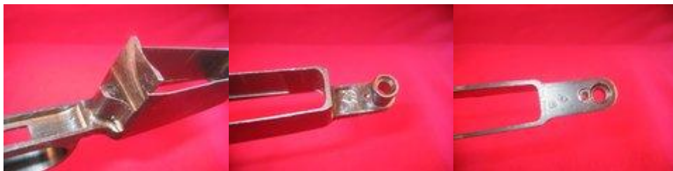
Frézované dno zásobníku nalevo z M48, lisované dno zásobníku napravo z M48BO.