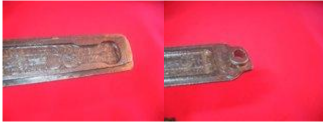
Lisované dno zásobníku napravo z M48BO.