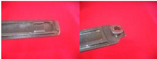
Lisovaný úchyt předpažbí nalevo z M48BO, frézovaný úchyt předpaždí napravo z M48.