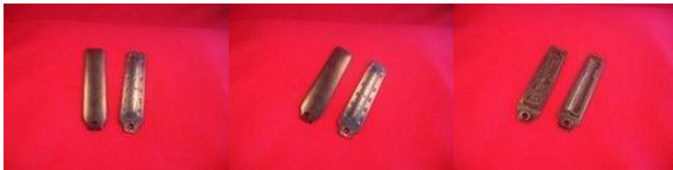
Frézované dno zásobníku nalevo z M48.